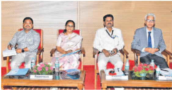
సదస్సులో పాల్గొన్న అతిథులు