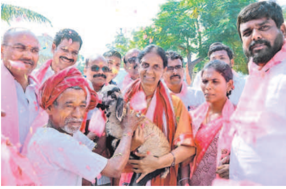
మంత్రి సబితాఇంద్రారెడ్డికి గౌరె పిల్లను బహుకరిస్తున్న గొల్ల కుర్తులు

ఎన్నికల ప్రచారంలో మంత్రి సబితా ఇంద్రారెడ్డి