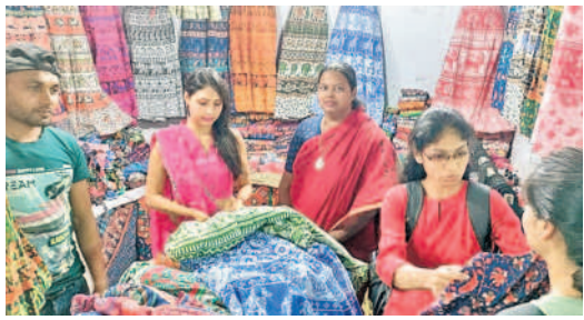
వస్త్రాలను కొనుగోలు చేస్తున్న మహిళలు