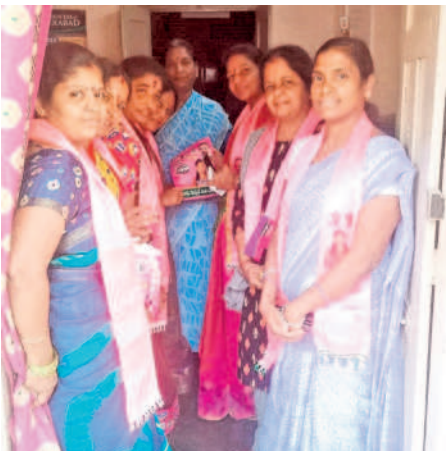
కస్ట్ మారేడ్పల్లి లో ప్రచారం నిర్వహిస్తున్న మాజీ కార్పొరేటర్ ఆకుల రూప