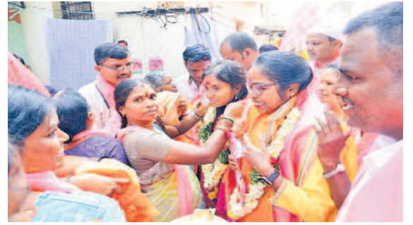
ప్రచారం లో భాగంగా అభ్యర్థి లాస్యనందితను పూలమాలతో సత్కరిస్తున్న మహిళలు