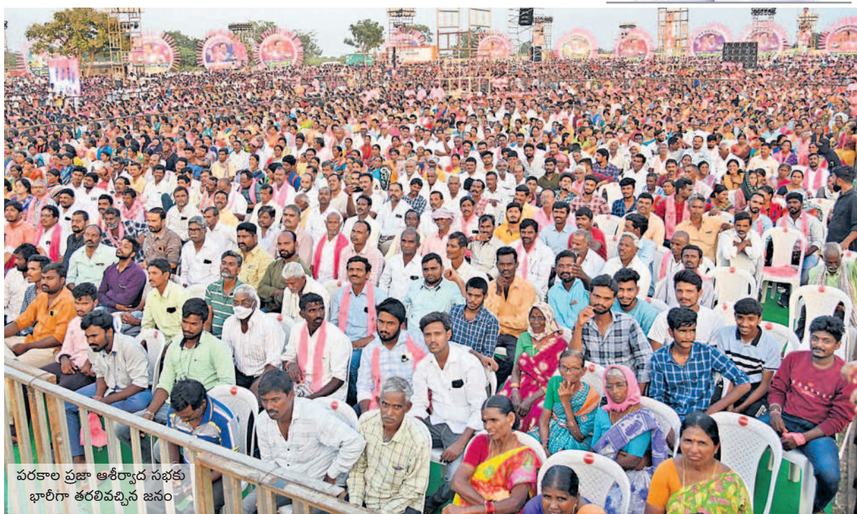
పరకాల ప్రజా ఆశీర్వాద సభకు భారీగా తరలివచ్చిన జనం