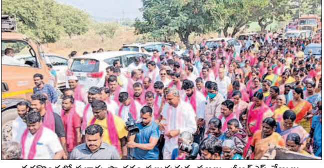
వడ్లకొండలో పల్లెకు స్వాగతం పలుకుతున్న ప్రజలు, బీఆర్ఎస్ శ్రేణులు