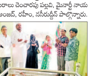
దర్గాలో పూజలు చేస్తున్న బీఆర్ఎస్ నాయకులు