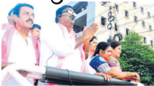
రోడ్ షా అభివాదం చేస్తున్న మంత్రి పువ్వాడ