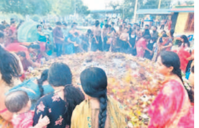
పాండురంగాపురంలో పుట్టలో పాలు పోస్తున్న భక్తులు, మాలధారులు

లాల ప్రజలు భక్తిశ్రద్ధలతో జరుపుకున్నారు. పాండురం గాపురంలో రామలింగేశ్వర ఆలయం తెల్లవారుజామున నుంచే భక్తులతో రద్దీగా కనిపించింది. రఘునాథపాలెం లోని పురాతన శివాలయంలో, ఖానాపురం అభయ వేంకటేశ్వరస్వామి ఆలయంలోని పుట్ట వద్ద మహిళలు, అయ్యప్ప భక్తులు భారీగా తరలివచ్చి పూజలు చేశారు. కూసుమంచి, నవంబర్ 17: కూసుమంచిలోని కాక తీయల నాటి శివాలయంలో ఉన్న పుట్ట వద్ద శుక్రవారం తెల్లవారుజాము నుంచే భక్తులు అధిక సంఖ్యలో పాల్గొని పూజలు చేశారు. చలిమిడి, నువ్వులు బెల్లం, పానకం,