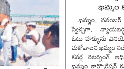
చెక్ పాస్టును తనిఖీ చేస్తున్న కలెక్టర్ గౌతమ్

కూసుమంచి, నవంబర్ 17: ఓటర్ లిస్టులోని ప్రతి ఇంటికి వెళ్లి పోల్ చిట్టిలు పంపిణీ చేయాలని బీఎల్ వోలు పూర్తి బాధ్యత తీసుకోవాలని కలెక్టర్ వీపీ గౌతమ్ అన్నారు. కూసుమంచిలో శుక్రవారం ఇంటింటి పోల్ స్లిప్ పంపిణీ కార్యక్రమాన్ని ఆయన ఆకస్మికంగా తనిఖీ చేశారు. కూసుమంచిలో ఇప్పటి వరకు ఇచ్చిన స్లిప్ల వివరాలను అడిగి తెలుసుకున్నారు. ప్రజల నుంచి పోలింగ్ తేదీ వివరాలను అడిగి తెలుసుకున్నారు. ఓటరు ఫోన్ ను తీసుకొని సీ విజిల్ యాప్ ను డౌన్ లోడ్ చేయించారు.