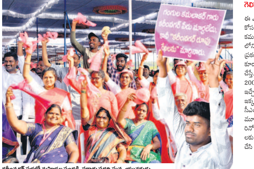
కరీంనగర్ సభలో మహిళల నందడి, ఫలకార్లు ప్రదర్శిస్తున్న యువకులు