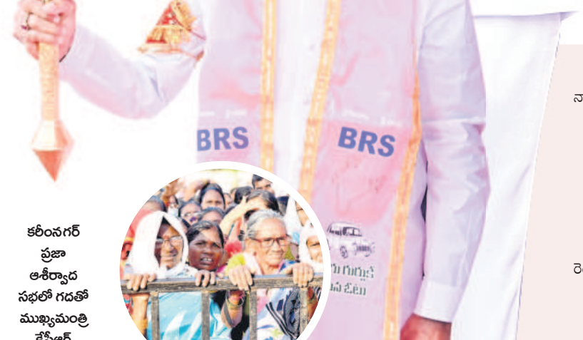
కరీంనగర్ ప్రజా ఆశీర్వాద సభలో గడత ముఖ్యమంత్రి కేసీఆర్