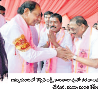
జమ్మికుంటలో కెస్సెల్ లక్ష్మీకాంతులతో కలిసిన కేసీఆర్