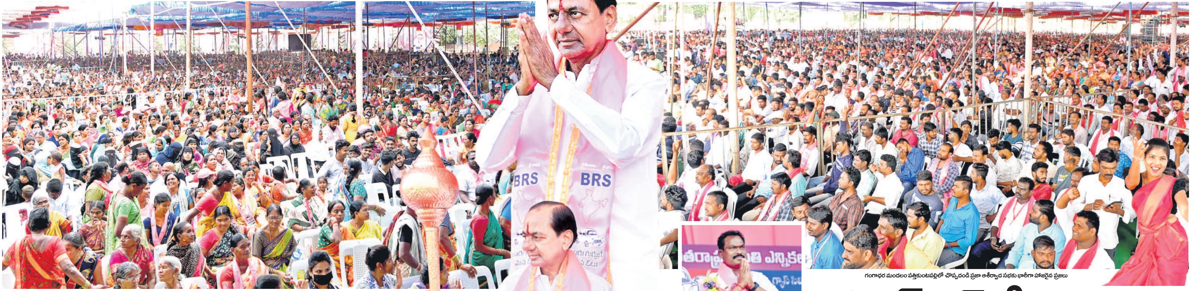
కరీంనగర్లో ముఖ్యమంత్రి ప్రజా ఆశీర్వాద సభకు భారీగా హాజరైన ప్రజలు