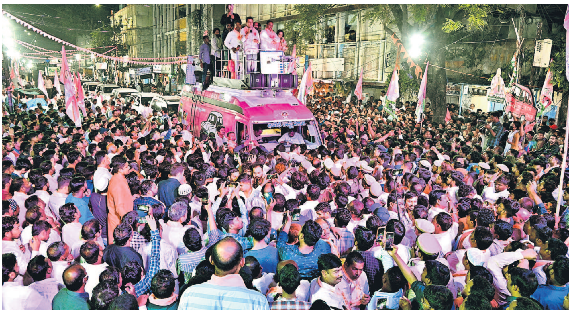
ఖైరతాబాద్ కమాట.. శుక్రవారం రాత్రి ఖైరతాబాద్లో నిర్వహించిన రోడ్ షోలో మాట్లాడుతున్న బీఆర్ఎస్ వర్కర్ల డివిజన్, మంత్రి కే తారకరామారావు. సభకు పెద్ద సంఖ్యలో హాజరైన ప్రజలు