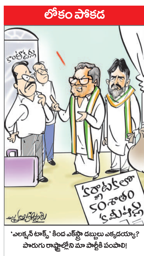
'ఎలక్షన్ టాక్' కింద ఎక్కడా డబ్బలు ఎక్కడయ్యా? పొరుగు రాష్ట్రాల్లోని మా పార్టీకి వంపా!