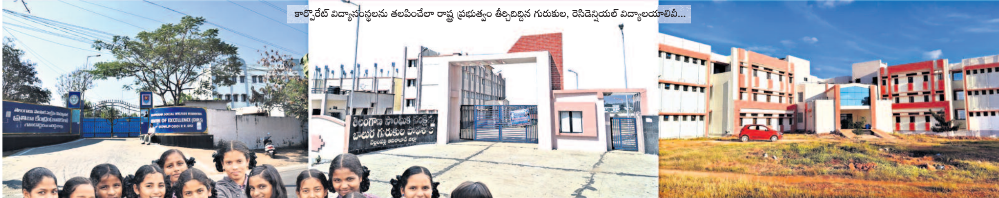
కార్పొరేట్ విద్యార్థులను తలపించేలా రాష్ట్ర ప్రభుత్వం తీర్చిదిద్దిన గురుకుల, రెసిడెన్షియల్ విద్యాలయాలు..