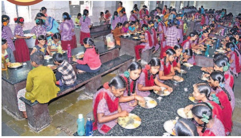
ఇంటిని మనిపించేలా సన్నబియ్యం బంప