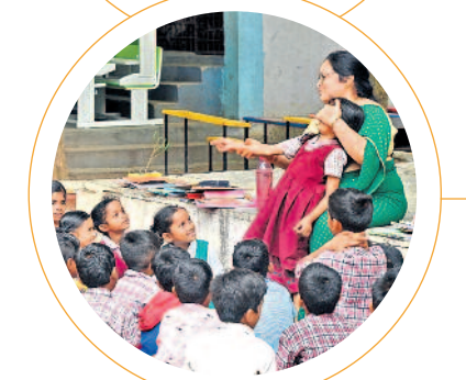
అమ్మలూ లాలిస్తూ.. ఆడుతూ పాడుతూ చదువులు