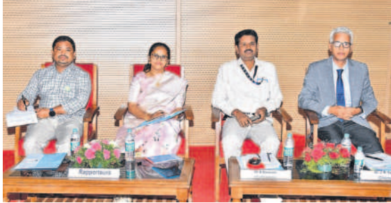
సదస్సులో పాల్గొన్న అతిథులు