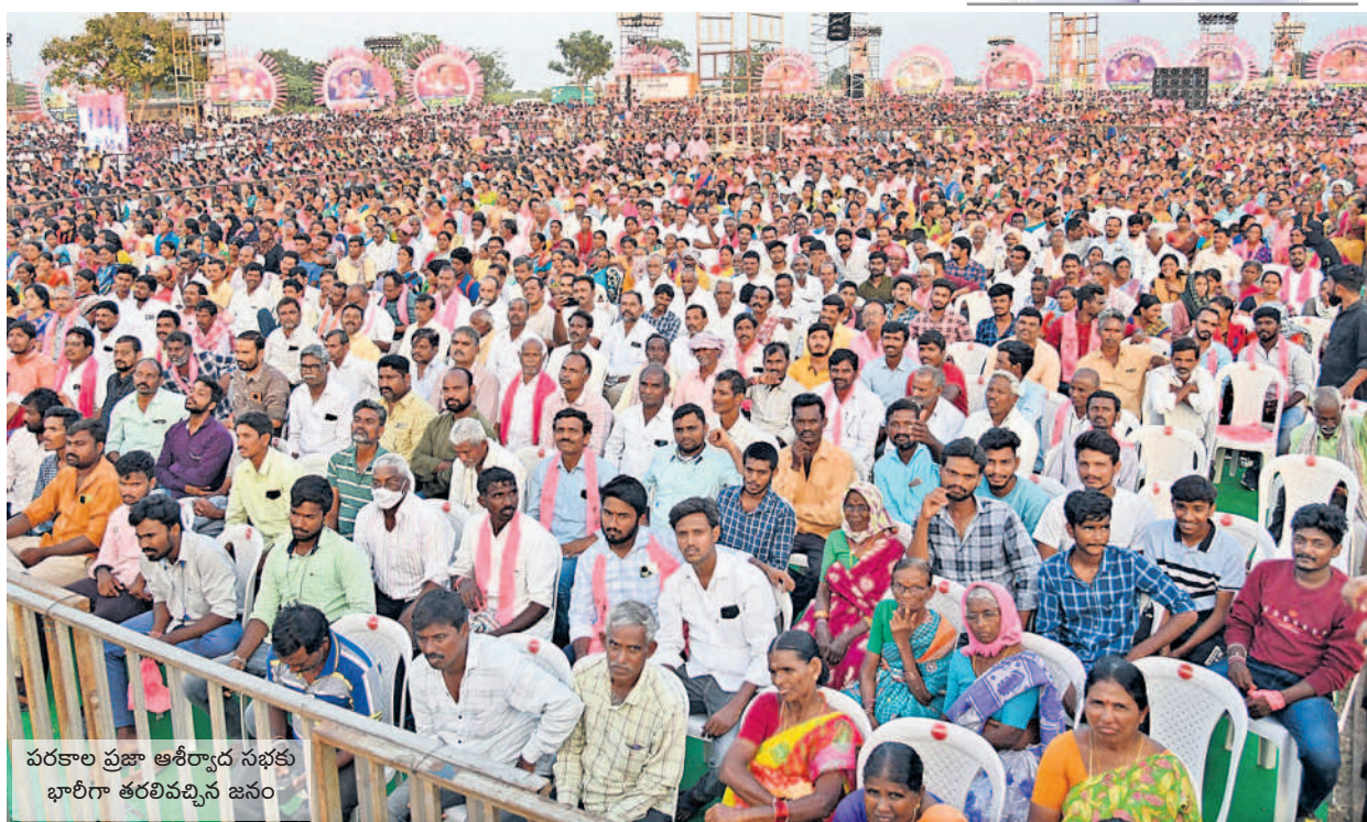
పరకాల ప్రజా ఆశీర్వాద సభకు భారీగా తరలివచ్చిన జనం