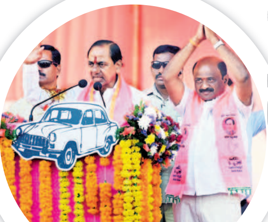
పరకాల ప్రజా ఆశీర్వాద సభలో ప్రసంగిస్తున్న సీఎం కేసీఆర్, పక్కన అభ్యర్థి చల్లా ధర్మారెడ్డి

'చల్లా ధర్మారెడ్డి ఎమ్మెల్యేగా ఉంటేనే పరకాల నియోజకవర్గం అన్నివిధాలా అభివృద్ధి చెందుతుంది.. ఆయన ఎంతో ఉత్తముడు.. ప్రజలు భారీ మెజార్టీతో చల్లాను దీవించాలి' అని బీఆర్ఎస్ అధినేత, సీఎం కేసీఆర్ ప్రజలకు పిలుపునిచ్చారు. ఎమ్మెల్యే, పరకాల బీఆర్ఎస్ అభ్యర్థి చల్లా ధర్మారెడ్డి ఆధ్వర్యంలో పరకాల పట్టణంలో శుక్రవారం ఏర్పాటు చేసిన నియోజకవర్గ ప్రజా ఆశీర్వాద సభకు వేలాదిగా తరలివచ్చిన జనాన్ని ఉద్దేశించి కేసీఆర్ మాట్లాడారు. చల్లా ఎప్పుడూ పరకాల నియోజకవర్గ అభివృద్ధి వనుల కోసమే తన వద్దకు వస్తారని, వ్యక్తిగతంగా ఏమీ అడగరని వివరించారు. ఆయన గెలిస్తే రైతుబంధు రూ. 16వేలు అవుతుందని, 24గంటల కరెంటు కొనసాగుతుందని స్పష్టం చేశారు. 'పాలిచ్చే బర్రెను వదులుకొని దున్నపోతును తెచ్చుకుంటారా?' అలోచించాలి అంటూ ప్రజలకు సూచించారు. - వరంగల్, నవంబర్ 17 (నమస్తే తెలంగాణ ప్రతినీధి)