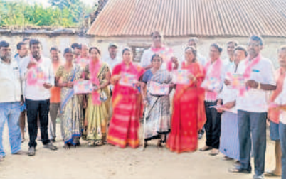
దంతాలపల్లి: తూర్పుతండాలో ఎన్నికల ప్రచారం నిర్వహిస్తున్న నాయకులు