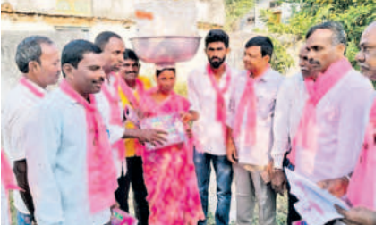
నర్సింహులపేట: జగ్గుతండాలో పథకాలను వివరిస్తున్న నాయకులు