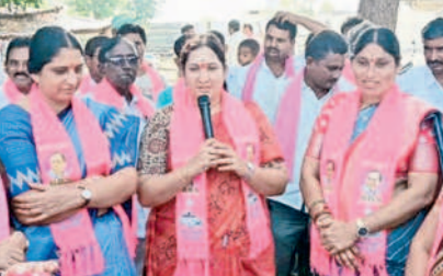
నర్సింహులపేట: కొమ్మలవంచలో మ్యానిఫెస్టోను వివరిస్తున్న మహిళా నాయకులు