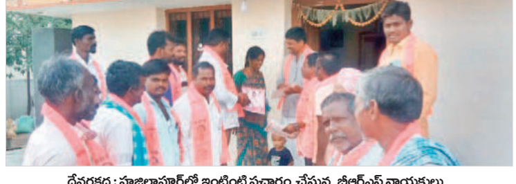
దేవరకర్త : హజిల్దార్ లో ఇంటింటి ప్రచారం చేస్తున్న బీఆర్ఎస్ నాయకులు