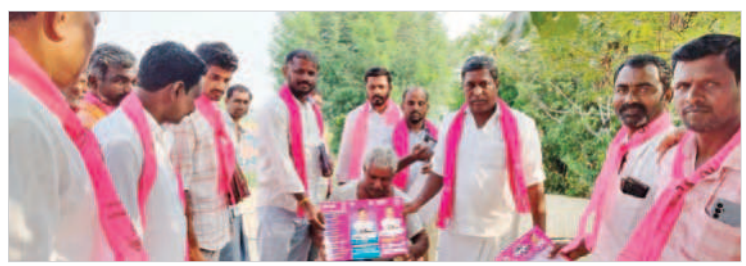
మదనాపురం : గోవిందహళ్లిలో ప్రచారం చేస్తున్న బీఆర్ఎస్ నాయకులు