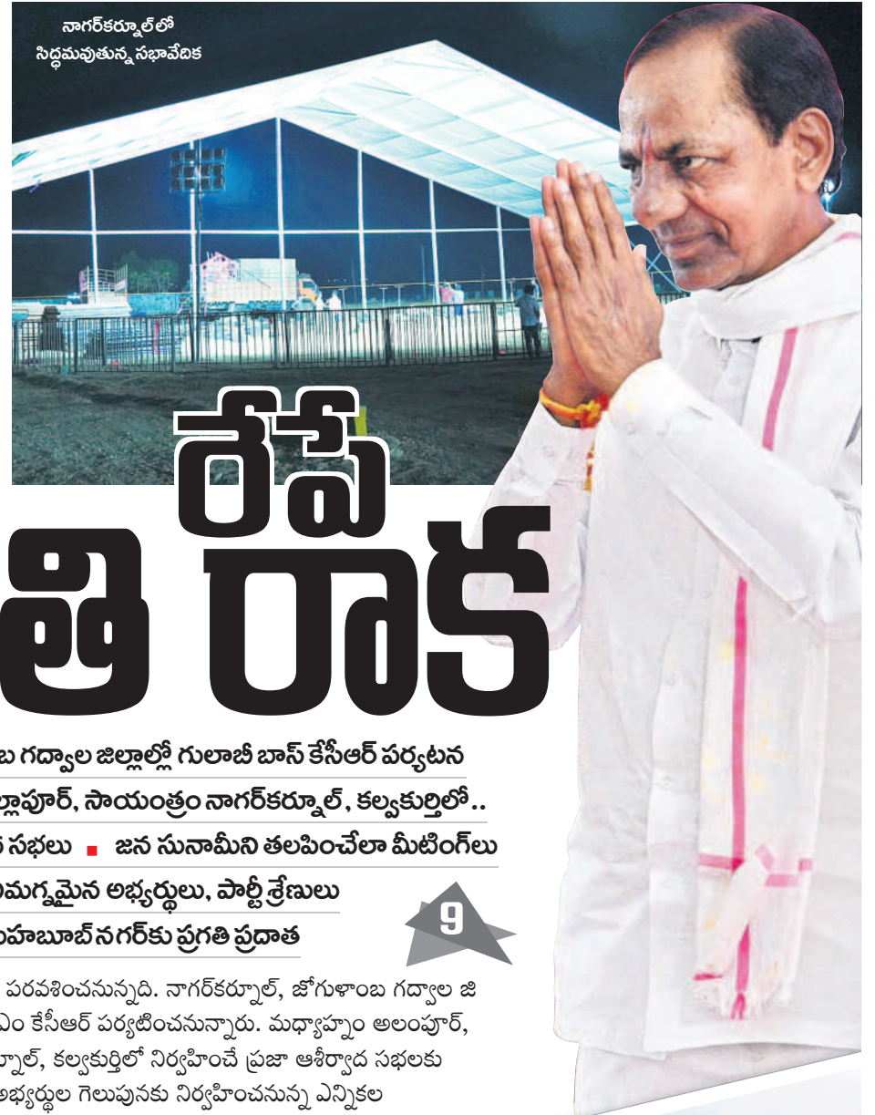
నాగర్ కర్నూల్ లో సిద్ధమవుతున్న సభావేదిక