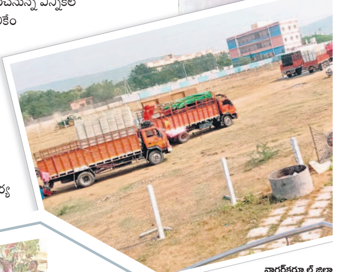
నాగర్ కర్నూల్ జిల్లా కొల్లాపూర్ పట్టణంలో సభ నిర్వహణకు కొనసాగుతున్న ఏర్పాట్లు

- మహబూబ్ నగర్, నవంబర్ 17 (నమస్తే తెలంగాణ ప్రతినది)