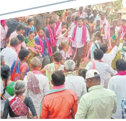
గ్రామస్థులతో కలిసి ఆడిపాడుతున్న ఎమ్మెల్యే బీరం