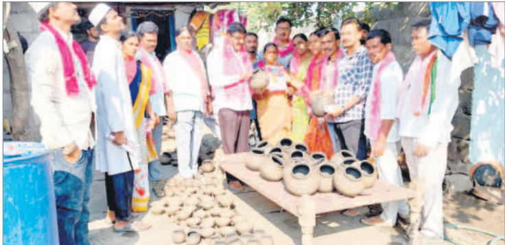
లక్కారంలో కుండలను పరిశీలించి ఓట్లు అడుగుతున్న నాయకులు