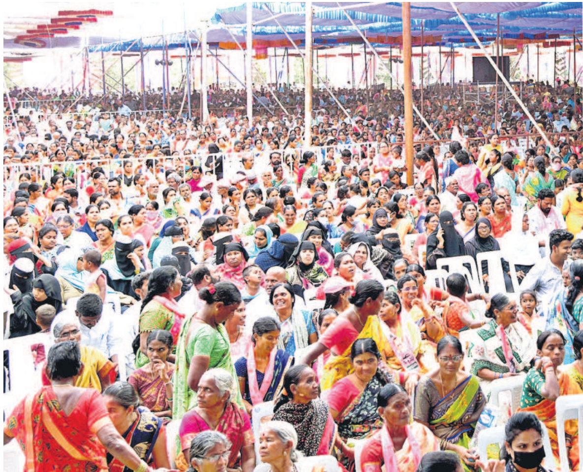
కరీంనగర్ లో ముఖ్యమంత్రి ప్రజా ఆశీర్వాద సభకు భారీగా హాజరైన ప్రజలు