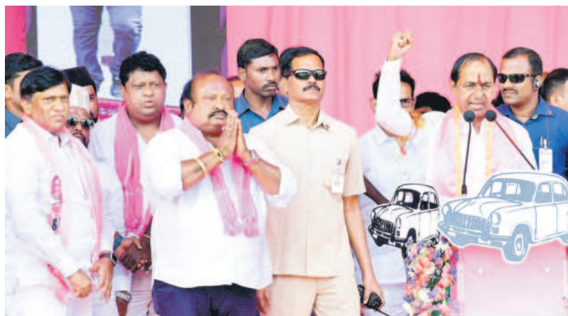
కరీంనగర్ ప్రజా ఆశీర్వాద సభలో మాట్లాడుతున్న సీఎం కేసీఆర్, పక్కన మంత్రి గంగుల కమలాకర్ జన సునామీ

కరీంనగర్, చొప్పదండి, హుజూరాబాద్ నియోజకవర్గాల ప్రజా ఆశీర్వాద సభలు శుభ్రవారం గ్రాండ్ సక్సెస్ అయ్యాయి. కరీంనగర్ లోని ఎస్సార్ కాలేజీ గ్రౌండ్, గంగాధర మండలం మదురానగర్ శివారులోని పత్రికలపల్లి, జమ్మికుంట పట్టణంలోని డిగ్రీ కళాశాల మైదానంలో సభలు నిర్వహించగా, ఆయా చోట్ల జనం పోలిల్లారు. ఒక రోజు మూడు చోట్ల సభలు జరిగినా.. అన్ని చోట్లా తండోపతండాలుగా.. వేలాదిగా తరలివచ్చారు. మైదానాలు సరిపోక బయట రోడ్లపైనే నిల్చున్నారు. అధినేత కేసీఆర్ ఆయాచోట్ల వేదికలపైకి చేరుకోగానే ప్రజలంతా ఈలలు, చప్పుట్లతో స్వాగతించారు. సీఎం ప్రసంగం సాగినంత సేపు... 'జై కేసీఆర్' 'జైజై కేసీఆర్' నినాదాలతో హా రెక్టించారు.