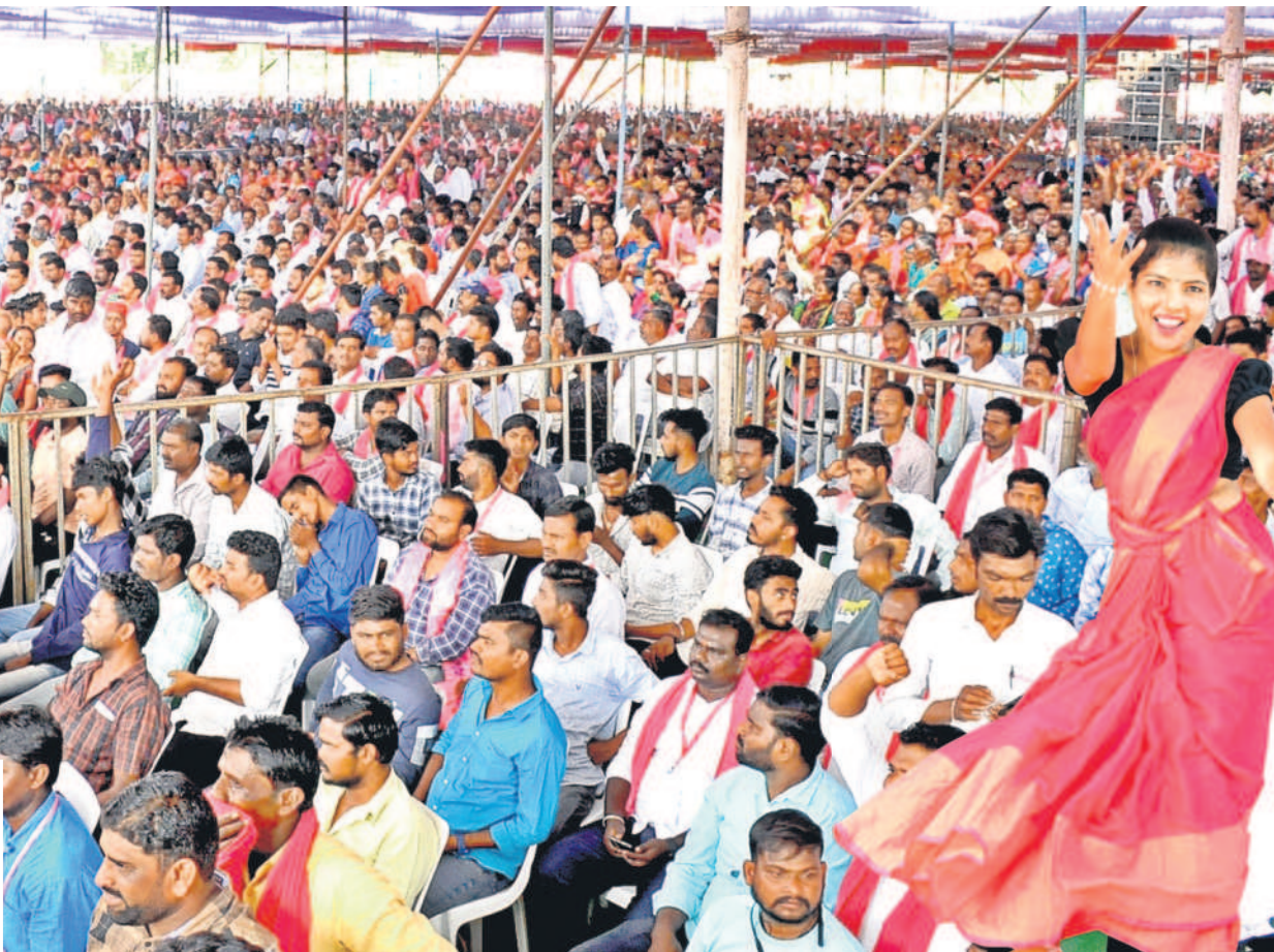
నృత్యం చేస్తున్న కళాకారిణి