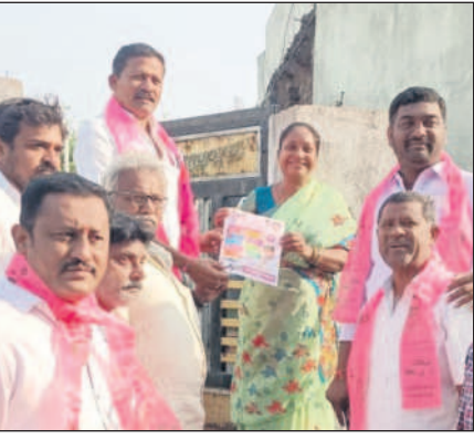
శంకరపట్నం: కొత్తగట్టులో ఎన్నికల ప్రచారం చేస్తున్న బీఆర్ఎస్ నాయకులు