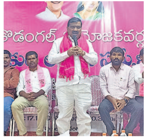
కొడంగల్ పట్టణంలో జరిగిన అటో డ్రైవర్ల ఆత్మీయ సమ్మేళనంలో మాట్లాడుతున్న మంత్రి మహేందర్ రెడ్డి

అటో డ్రైవర్ల ఆత్మీయ సమ్మేళనంలో గనులు, భూగర్భ వనరుల శాఖల మంత్రి మహేందర్ రెడ్డి