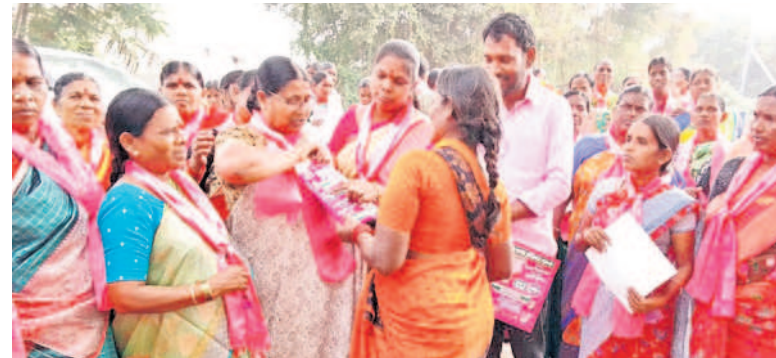
ప్రచారంలో పాల్గొన్న ఎంపీపీ భవాని, బీఆర్ఎస్ నేతలు (ఫైర్)

నవాబుపేట, నవంబర్ 17 : సీఎం కేసీఆర్ అమలుజే స్తున్న సంక్షేమ పథకాలే శ్రీరామ రక్షగా బీఆర్ఎస్ నేతలు నవాబుపేట మండలంలోని గ్రామాల్లో విస్తృత ప్రచారం చేస్తూ ఓటర్ల వద్దకు వెళ్ళి ఓటు అడుగుతూ ఎన్నికల మ్యూనిఫెస్టోలోని ప్రతి అంశాన్ని వివరిస్తూ ప్రచారంలో దూసుకుపోతున్నారు. మండలంలోని ప్రతి గ్రామంలో అభివృద్ధి, సంక్షేమ ఫలాలు అందుతు న్నాయని ప్రజలకు వివరిస్తున్నారు. తాగునీరు, సాగు నీటికి కొడువలేదని రైతులకు ఉచిత కరెంట్ ఇస్తూ కన్నీళ్లు తుడిచారని గుర్తుజేస్తున్నారు. మండలంలో ఉన్న 32 గ్రామపంచాయతీల్లో ప్రచారాన్ని వేగవంతం చేసి కాలె యాదయ్యను గెలిపించాలని కోరుతున్నారు. ఎంపీపీ, మార్కెట్ కమిటీ చైర్మన్, పార్టీ మండల అధ్య క్షుడు కలిసి ఓటర్ల వద్దకు వెళ్ళున్నారు. ప్రజా సంక్షేమమే బీఆర్ఎస్ ప్రథమ లక్ష్యమని ప్రచారం చేస్తున్నారు.