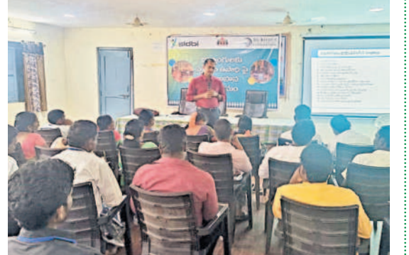
శిక్షణ తరగతులకు హాజరైన దివ్యాంగులు