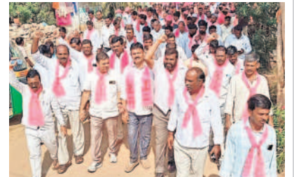
కొండాపూర్ : తేర్లవల్ లో బీఆర్ఎస్ నేతల ప్రచారం