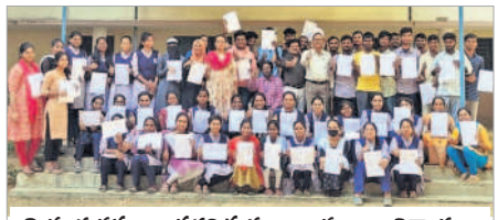
నియామక పత్రాలు ప్రదర్శిస్తున్న తారా కళాశాల విద్యార్థులు