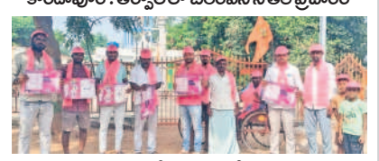
కంది : మక్త అల్లూర్ లో ప్రచారం చేస్తున్న నాయకులు