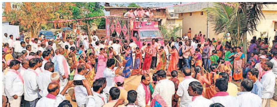
కొండాపూర్ : ఎన్నికల ప్రచార ర్యాలీలో కోలాటం ఆడుతున్న మహిళలు