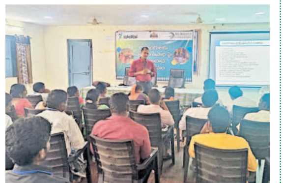
శిక్షణ తరగతులకు హాజరైన దివ్యాంగులు