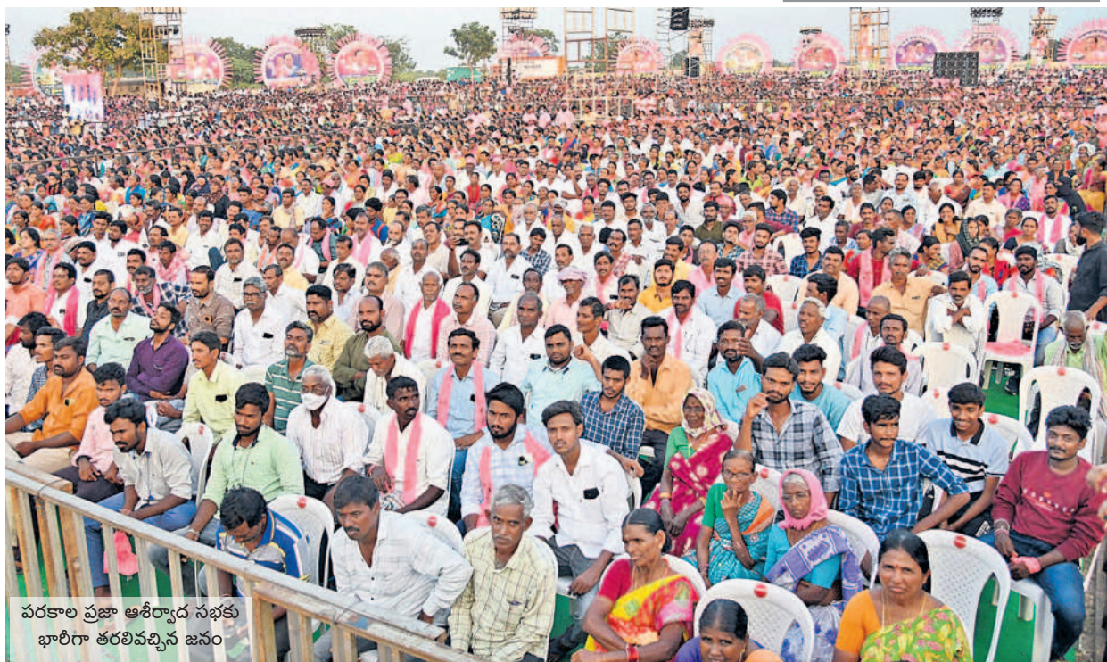
పరకాల ప్రజా ఆశీర్వాద సభకు భారీగా తరలివచ్చిన జనం