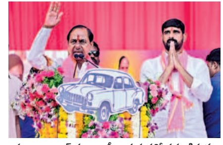
హుజూరాబాద్ ప్రజా ఆశీర్వాద సభలో ప్రసంగిస్తున్న సీఎం కేసీఆర్, పక్కన ఎమ్మెల్యే అభ్యర్థి కొశిక్ రెడ్డి

వచ్చిన తర్వాత తెలంగాణ ఇవ్వకండా అనేక మంది బలిదానాలకు కారణమైందని మండిపడ్డారు. కాంగ్రెస్ మనల్ని మోసం చేసిందని, ఇప్పుడు కేంద్రంలో అధికారంలో ఉన్న బీజేపీ చట్టాన్ని అతిక్రమించిందని, ప్రతి జిల్లాకు ఒక నవోదయ పాఠశాల ఇవ్వాలి ఉండగా తెలంగాణకు ఒక్కటి కూడా ఇవ్వలేదన్నారు. దేశంలో 157 మెడికల్ కళాశాలలు ఏర్పాటు చేసిన బీజేపీ ప్రభుత్వం తెలంగాణకు మాత్రం ఒక్కటి కూడా ఇవ్వలేదని మండిపడ్డారు. నవోదయ పాఠశాలలు, మెడికల్ కళాశాల కోసం వంద లేఖలు రాశానని గుర్తు చేశారు. కరెంట్ మోటార్లకు మీటర్లు పెట్టాలని ప్రధాని నరేంద్ర మోదీ ఆదేశించారని, తెలంగాణలో నేను ఒప్పుకోకపోతే ఏడాదికి రూ.5 వేల కోట్ల చొప్పున ఇప్పటి వరకు రూ.25 వేల కోట్లు కోతలు పెట్టారని తెలిపారు. హుజూరాబాద్ లో గెలిచి పెద్ద మూటలు మాట్లాడిన ఈటల రాజేందర్ వీటి గురించి ఎందుకు మాట్లాడడని ప్రశ్నించారు. కొశిక్ రెడ్డి బీఆర్ఎస్