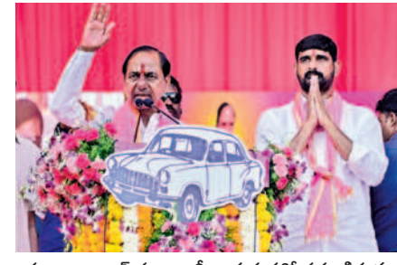
హుజూరాబాద్ ప్రజా ఆశీర్వాద సభలో ప్రసంగిస్తున్న సీఎం కేసీఆర్, పక్కన ఎమ్మెల్యే అభ్యర్థి కొశిక్ రెడ్డి

వచ్చిన తర్వాత తెలంగాణ ఇవ్వకండా అనేక మంది బలిదానాలకు కారణమైందని మండిపడ్డారు. కాంగ్రెస్ మనల్ని మోసం చేసిందని, ఇప్పుడు కేంద్రంలో అధికారంలో ఉన్న బీజేపీ చట్టాన్ని అతిక్రమించిందని, ప్రతి జిల్లాకు ఒక నవోదయ పాఠశాల ఇవ్వాలి ఉండగా తెలంగాణకు ఒక్కటి కూడా ఇవ్వలేదన్నారు. దేశంలో 157 మెడికల్ కళాశాలలు ఏర్పాటు చేసిన బీజేపీ ప్రభుత్వం తెలంగాణకు మాత్రం ఒక్కటి కూడా ఇవ్వలేదని మండిపడ్డారు. నవోదయ పాఠశాలలు, మెడికల్ కళాశాల కోసం వంద లేఖలు రాశానని గుర్తు చేశారు. కరెంట్ మోటార్లకు మీటర్లు పెట్టాలని ప్రధాని నరేంద్ర మోదీ ఆదేశించారని, తెలంగాణలో నేను ఒప్పుకోకపోతే ఏడాదికి రూ.5 వేల కోట్ల చొప్పున ఇప్పటి వరకు రూ.25 వేల కోట్లు కోతలు పెట్టారని తెలిపారు. హుజూరాబాద్ లో గెలిచి పెద్ద మాటలు మాట్లాడిన ఈటల రాజేందర్ వీటి గురించి ఎందుకు మాట్లాడడని ప్రశ్నించారు. కొశిక్ రెడ్డి బీఆర్ఎస్