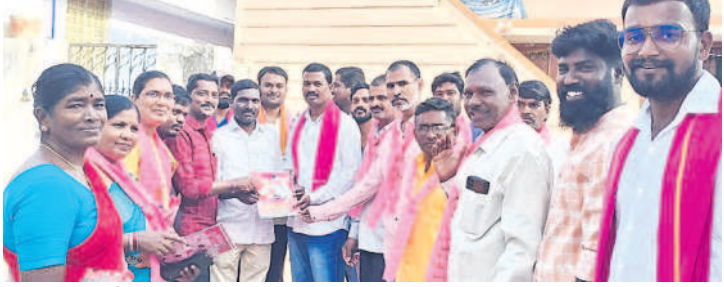
భువనగిరి సిటీ : పట్టణంలోని 8వ వార్డులో ఇంటింటి ప్రచారం నిర్వహిస్తున్న కౌన్సిలర్ స్వామి