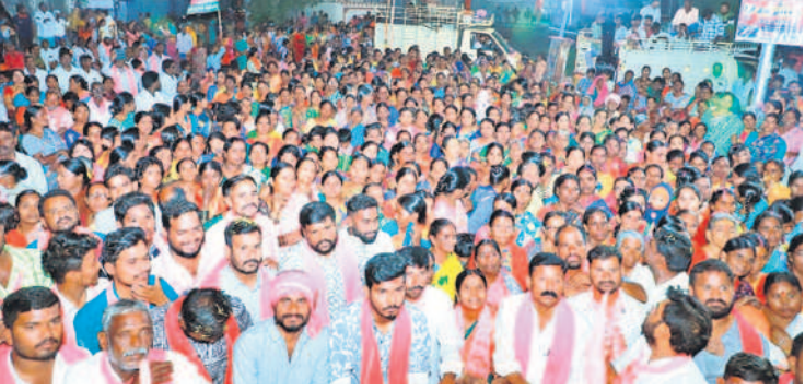
సర్వేల్ గ్రామంలో ఎమ్మెల్యే కూసుకుంట్ల ప్రచారానికి హాజరైన ప్రజలు

మండలంలో ఎమ్మెల్యే కూసుకుంట్ల ప్రభాకర్ రెడ్డి ప్రచారానికి వస్తున్నాడని తెలుసుకొన్న బీఆర్ఎస్ కార్యకర్తలు, స్థానికులు పెద్ద ఎత్తున తరలి వచ్చి ఘనంగా స్వాగతం పలికారు. గ్రామ శివారు నుంచి గ్రామంలోకి భారీ ర్యాలీ నిర్వహించారు. కోలాటాలు, డబ్బులు, బోనాలు, బతుకమ్మలతో