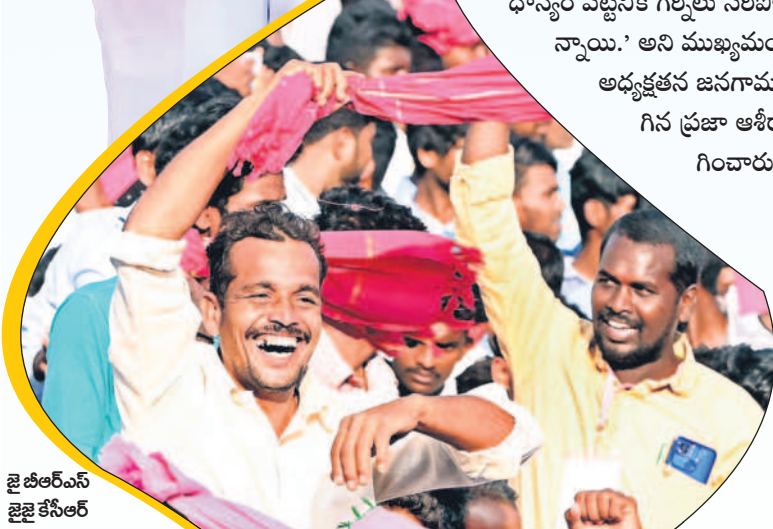
జై బీఆర్ఎస్ జై కేసీఆర్