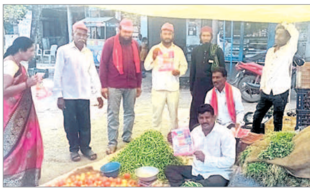
ఉట్కూర్ రూరల్ : లక్కారంలో వినూత్నంగా ప్రచారం చేస్తున్న బీఆర్ఎస్ నాయకులు