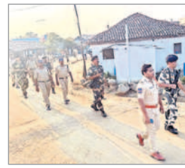
కమాతు చేస్తున్న పోలీసులు