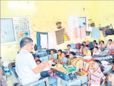
విద్యార్థుల హాజరును పరిశీలిస్తున్న ఆర్కీవో