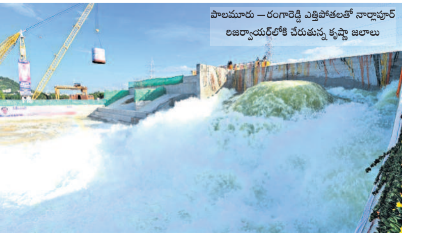
పాలమూరు - రంగారెడ్డి ఎత్తిపోతలలో నారాయణ్ రిజర్వాయర్లోకి చేరుతున్న కృష్ణా జలాలు