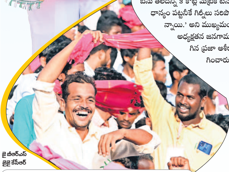
జై బీఆర్ఎస్ జై కేసీఆర్