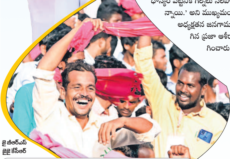
జై బీఆర్ఎస్ జై కేసీఆర్