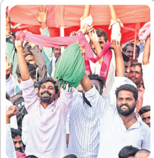
ఉరకలెత్తే ఉత్సాహం : సభలో అభిమానుల జోష్