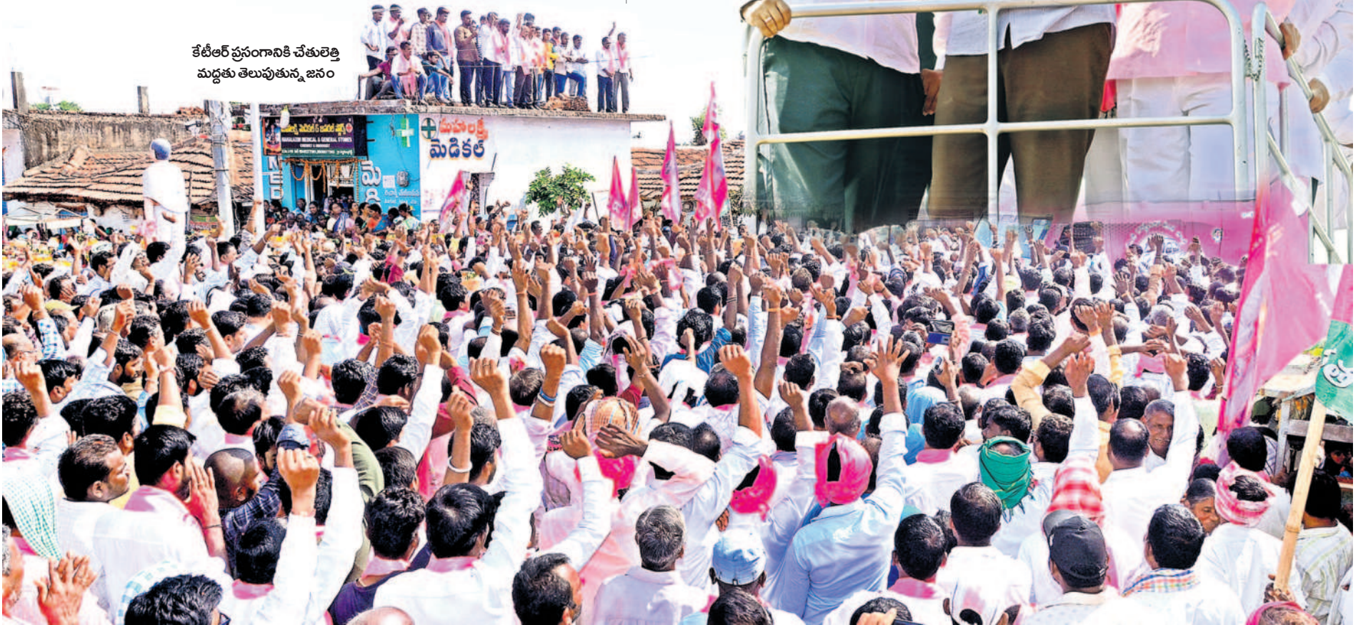
కేటీఆర్ ప్రసంగానికి చేతులెత్తి మద్దతు తెలుపుతున్న జనం