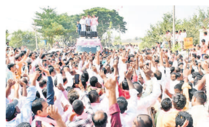
పెద్దమల్లారెడ్డిలో మంత్రి కేటీఆర్ కు స్వాగతం పలుకుతున్న గ్రామస్థులు