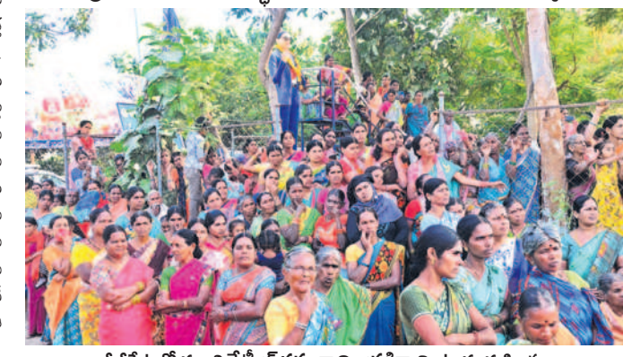
బీబీపేటలో మంత్రి కేటీఆర్ ప్రసంగాన్ని ఆసక్తిగా వింటున్న మహిళలు

నిజామాబాద్, నవంబర్ 18 (నమస్తే తెలంగాణ ప్రతినది)/ భక్తూర్, బీబీపేట: