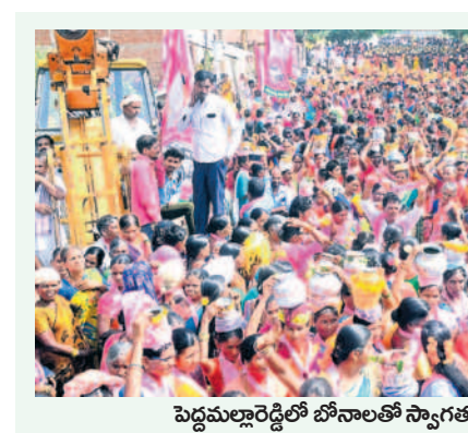
పెద్దమల్లారెడ్డిలో బోనాలతో స్వాగతం పలుకుతున్న గ్రామస్థులు

చేశారు. పోలాల్లో 10 హెక్టార్ల మోటార్లు బిగిస్తే భూగర్భ జలం మిగులుతుందా? అని ప్రశ్నించారు. కేటీఆర్ ను కాపాడుకుంటేనే ప్రజలందరూ సాభాగ్యంగా ఉంటారన్నారు. రుణమాఫీ అందని రైతులు ఫిరకం పడాలని పనిలేదన్నారు. వారికి కొత్త ప్రభుత్వంలో నిధులు విడుదల చేసి అడుగుంటామన్నారు. రుణమాఫీ పూర్తిస్థాయిలో అమలు కాకుండా అడ్డుకున్నది కాంగ్రెస్ పార్టీ వారినని చెప్పారు. రైతుబీమా మాదిరిగానే తెల్ల రేపన్ కాబట్టారంటూ కేటీఆర్ బీమా పథకం అందిస్తున్నామన్నారు. డొడ్డు బియ్యం స్థానంలో సన్నబియ్యం సరఫరా చేయ బోతున్నట్లుగా చెప్పారు. గ్యాస్ సిలిండర్ ధరలను మోడి పెంచితే కేటీఆర్ తగ్గించి రూ. 400కే అందించేందుకు సిద్ధమవుతామన్నారు. దీంతో దళిత, గిరిజన, బలహీన వర్గాలకు మేలు జరుగుతుందని చెప్పారు. కామారెడ్డికి ఏడాదిన్నర కాలంలోనే గోదావరి జలాలు అందిస్తామన్నారు. ఈ ప్రాంతంలో ప్రతి ఎకరానికి నీళ్లన్నీ తీరుతామన్నారు.