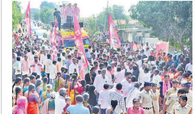
కామారెడ్డిలో మంత్రి కేటీఆర్ కు స్వాగతం పలుకుతున్న గ్రామస్థులు