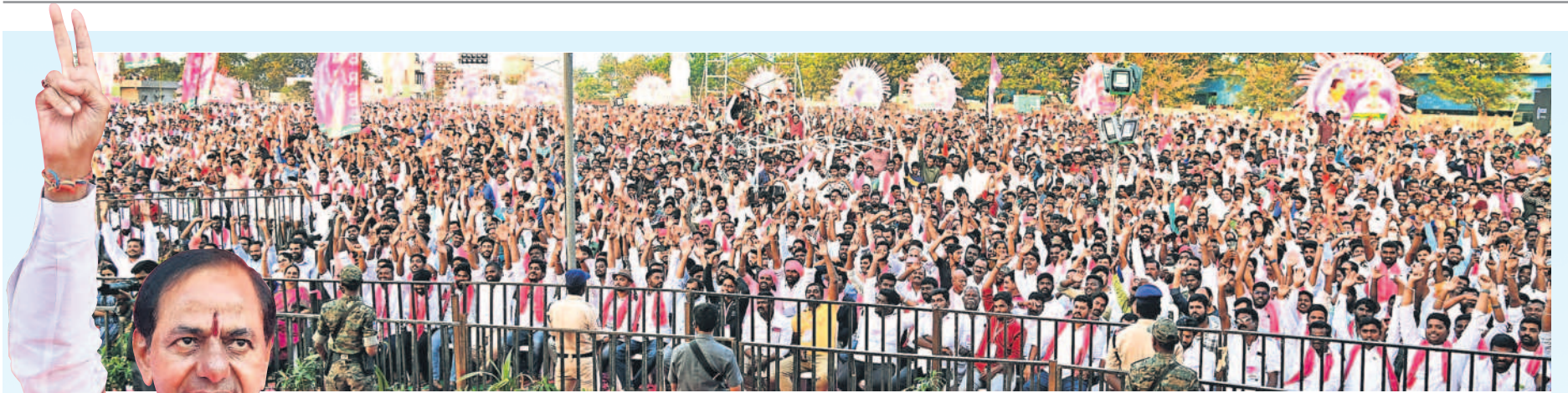
చేర్యాల ప్రజా ఆశీర్వాద సభకు పెద్ద ఎత్తున హాజరైన జనం, అభివాదం చేస్తున్న సీఎం కేసీఆర్