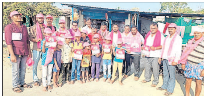
లింగాపూర్: నడ్లంగూడలో బీఆర్ఎస్ మ్యూనిసిపాలిటీ కరపత్రాలు అందజేస్తున్న బీఆర్ఎస్ నాయకులు