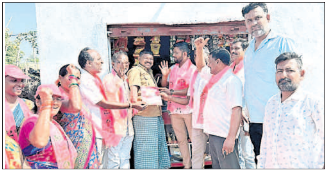
ఆసిఫాబాద్: జన్యాపూర్లో ప్రచారం నిర్వహిస్తున్న బీఆర్ఎస్ నాయకులు