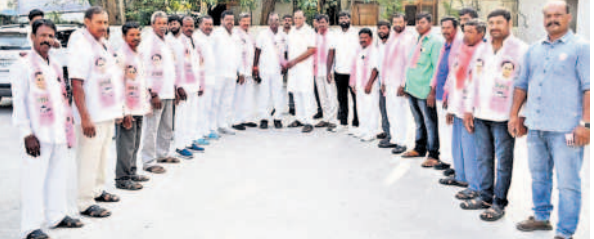
మంత్రి మల్లారెడ్డి సమక్షంలో బీఆర్ఎస్లో చేరుతున్న కొర్రెముల గ్రామ కాంగ్రెస్, యాదవ సంఘం నాయకులు