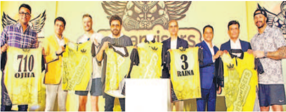
లెజెండ్స్ లీగ్ క్రికెట్ జెర్నీని ఆవిష్కరిస్తున్న హీరో వెంకటేశ్, మాజీ క్రికెటర్లు