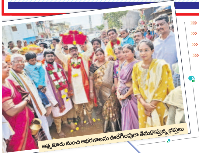
ఆత్మకూరు నుంచి ఆభరణాలను ఊరేగింపుగా తీసుకొస్తున్న భక్తులు