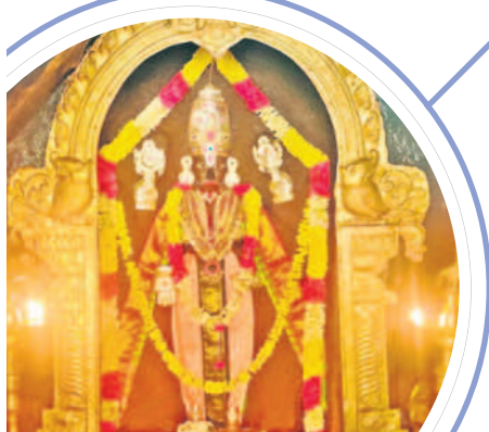
ఆభరణాల వెలుగుల్లో కాంతులీనుతున్న కురుమూర్తి రాయుడు

- ఆత్మకూరు/దేవరకద్ర రూరల్ (సీసీకుంట)/అమరచింత, నవంబర్ 18