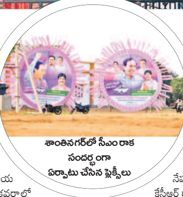
శాంతినగర్ లో సీఎం రాక సందర్భంగా ఏర్పాటు చేసిన ఫ్లెక్సీలు

నగా, ఆలస్యంగా వచ్చినా జనం కదలకుండా కుర్చో వడం, కనీవీ ఏరుగని రీతిలో సభలు సక్సెస్ కావడంతో గులాబీ శ్రేణుల్లో ఉత్సాహం రెట్టింపయ్యింది. తాజాగా మరో సారి నాలుగు సభల్లో కేసీఆర్ పాల్గొంటుండడంతో విపక్షాల్లో వణుకుపుడుతున్నది. ఇప్పటికే ఆయా పార్టీల అధినాయకులు ఒకటి, రెండు నియోజకవర్గాల్లో మాత్రమే ప్రచారంలో పాల్గొన్నారు. మిగతా నియోజకవర్గాల్లో వస్తారో, రాకోననే బెంగ విపక్షాల అభ్యర్థుల్లో ఉంది. కానీ బీఆర్ఎస్ అధినేత అన్ని నియోజకవర్గాల్లో సభల్లో పాల్గొంటుండడంతో ప్రతిపక్షాలు ఆయామయానికి గురవుతున్నాయి.