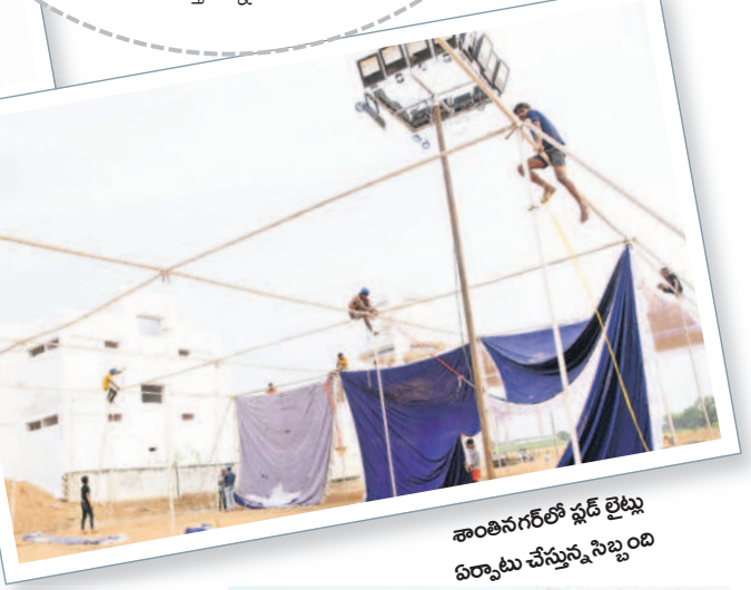
శాంతినగర్ లో ఫ్లడ్ లైట్లు ఏర్పాటు చేస్తున్న సిబ్బంది