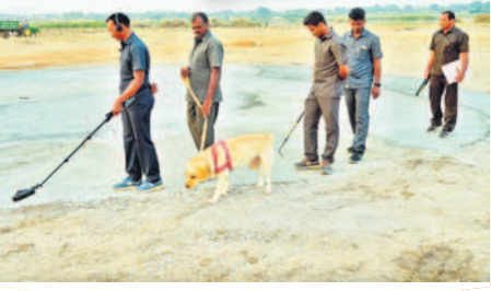
నాగర్ కర్నూల్ లో హెలిప్యాడ్ వద్ద డాగ్ స్క్వాడ్ తో పరిశీలిస్తున్న పోలీసు సిబ్బంది