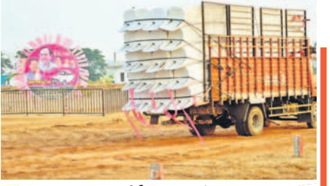
నాగర్ కర్నూల్ లో సీఎం సభకు తీసుకొచ్చిన సామగ్రి