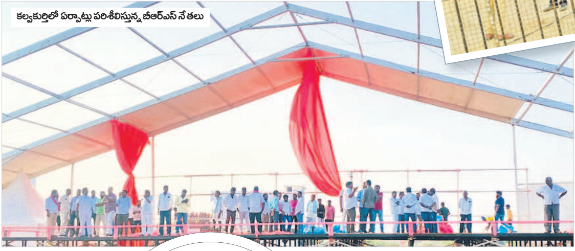
కల్వకుర్తిలో ఏర్పాటు పరిశీలిస్తున్న బీఆర్ఎస్ నేతలు

మహబూబ్ నగర్, నవంబర్ 18 (నమస్తే తెలంగాణ ప్రతినీడి) : బీఆర్ఎస్ అధినేత, ప్రగతి ప్రధాత కేసీఆర్ ఉమ్మడి జిల్లాలో నాలుగు ప్రజా ఆశీర్వాద సభల్లో నేడు పాల్గొంటున్నారు. జోగు లాంబ గద్వాల, నాగర్ కర్నూల్ జిల్లాలో ఎన్నికల జైత్రయాత్ర చేపట్టనున్నారు. ఈ మేరకు ఆయా నియోజకవర్గాల్లో పార్టీ అభ్యర్థులు, నాయకులు ఏర్పాట్లు చేస్తున్నారు. పెద్ద ఎత్తున జనసమీకరణ చేసే సభను విజయవంతం చేసేందుకు పోటాపో టీగా ఏర్పాట్లు చేస్తున్నారు. అసెంబ్లీ ఎన్నికల తుది అంకం ఘరూ కావడంతో కేసీఆర్ ప్రజాఆశీర్వాద సభలను చాలెంజ్ గా తీసుకుని పార్టీ శ్రేణులు ఏర్పాట్లతో తలమునకలయ్యారు. మధ్యాహ్నం ఒంటిగంటకు అలంపూర్లో ప్రజాఆశీర్వాద సభ పారంభంకానున్నది. మధ్యాహ్నం 2 గంటలకు కొల్లాపూర్లో, సాయంత్రం 3 గంటలకు నాగర్ కర్నూల్, 4 గంటలకు కల్వకుర్తిలో జరిగే ప్రజాఆశీర్వాద సభల్లో పాల్గొంటారు. పార్టీ అధినేత రాకతో ఆయా నియోజకవర్గ కేంద్రాలు గులాబీ మయంగా మారాయి. సభా వేదిక చుట్టూ భారీ కటాట్లు, ఫ్లెక్సీలు ఏర్పాటు చేశారు. రహదారులన్నీ జెండాలు, ఫ్లెక్సీలతో నిండిపోయాయి. గ్రామాల నుంచి పెద్దఎత్తున జనం కదలివస్తుండడంతో పోలీసు యంత్రాంగం భారీ బందోబస్తు ఏర్పాటు చేసింది. ఎక్కడ ఎలాంటి ఇబ్బందులు కలుగ కుండా సభా ప్రాంగణం చేరుకునేలా ఏర్పాట్లు చేస్తున్నారు. వివిధ ప్రాంతాల నుంచి వాహనాలను ఎలాంటి ఇబ్బందులు లేకుండా పార్కింగ్ చేసుకునేలా చదును చేశారు. జనాలు వచ్చి పోవడానికి ఇబ్బందులు లేకుండా పార్టీ నాయకులు అన్ని ఏర్పాట్లు చేస్తున్నారు. నవంబర్ 16 తేదీన కేసీఆర్ ఉమ్మడి జిల్లాలో ఏకంగా నాలుగు సభల్లో పాల్గొ