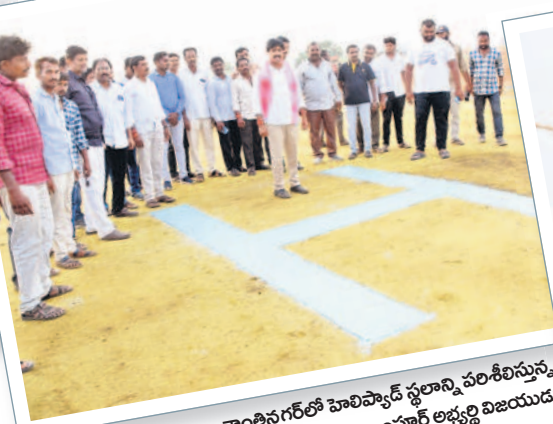
శాంతినగర్ లో హెలిప్యాడ్ స్థలాన్ని పరిశీలిస్తున్న అలంపూర్ అభ్యర్థి విజయదు