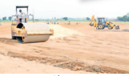
శాంతినగర్ లో సీఎం సభ ప్రాంగణాన్ని చదును చేస్తున్న ధృత్యం