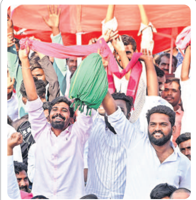
ఉరకలెత్తే ఉత్సాహం : సభలో అభిమానుల జోష్