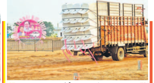
నాగర్ కర్నూల్ లో సీఎం సభకు తీసుకొచ్చిన సామగ్రి