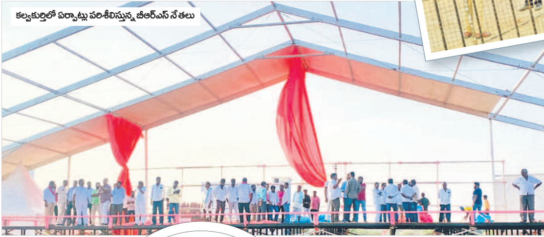
కల్వకుర్తిలో ఏర్పాటు పరిశీలిస్తున్న బీఆర్ఎస్ నేతలు

మహబూబ్ నగర్, నవంబర్ 18 (నమస్తే తెలంగాణ ప్రతినీడి) : బీఆర్ఎస్ అధినేత, ప్రగతి ప్రధాత కేసీఆర్ ఉమ్మడి జిల్లాలో నాలుగు ప్రజా ఆశీర్వాద సభల్లో నేడు పాల్గొంటున్నారు. జోగు లాంబ గద్వాల, నాగర్ కర్నూల్ జిల్లాలో ఎన్నికల జైత్రయాత్ర చేపట్టనున్నారు. ఈ మేరకు ఆయా నియోజకవర్గాల్లో పార్టీ అభ్యర్థులు, నాయకులు ఏర్పాట్లు చేస్తున్నారు. పెద్ద ఎత్తున జనసమీకరణ చేసే సభను విజయవంతం చేసేందుకు పోటాపో టీగా ఏర్పాట్లు చేస్తున్నారు. అసెంబ్లీ ఎన్నికల తుది అంకం ఘరూ కావడంతో కేసీఆర్ ప్రజాఆశీర్వాద సభలను చాలెంజ్గా తీసుకుని పార్టీ శ్రేణులు ఏర్పాట్లతో తలమునకలయ్యారు. మధ్యాహ్నం ఒంటిగంటకు అలంపూర్లో ప్రజాఆశీర్వాద సభ పారంభంకానున్నది. మధ్యాహ్నం 2 గంటలకు కొల్లాపూర్లో, సాయంత్రం 3 గంటలకు నాగర్ కర్నూల్, 4 గంటలకు కల్వకుర్తిలో జరిగే ప్రజాఆశీర్వాద సభల్లో పాల్గొంటారు. పార్టీ అధినేత రాకతో ఆయా నియోజకవర్గ కేంద్రాలు గులాబీ మయంగా మారాయి. సభా వేదిక చుట్టూ భారీ కటాట్లు, ఫ్లెక్సీలు ఏర్పాటు చేశారు. రహదారులన్నీ జెండాలు, ఫ్లెక్సీలతో నిండిపోయాయి. గ్రామాల నుంచి పెద్దఎత్తున జనం కదలివస్తుండడంతో పోలీసు యంత్రాంగం భారీ బందోబస్తు ఏర్పాటు చేసింది. ఎక్కడ ఎలాంటి ఇబ్బందులు కలుగ కుండా సభా ప్రాంగణం చేరుకునేలా ఏర్పాట్లు చేస్తున్నారు. వివిధ ప్రాంతాల నుంచి వాహనాలను ఎలాంటి ఇబ్బందులు లేకుండా పార్కింగ్ చేసుకునేలా చదును చేశారు. జనాల వచ్చి పోవడానికి ఇబ్బందులు లేకుండా పార్టీ నాయకులు అన్ని ఏర్పాట్లు చేస్తున్నారు. నవంబర్ 16వ తేదీన కేసీఆర్ ఉమ్మడి జిల్లాలో ఏకంగా నాలుగు సభల్లో పాల్గొ