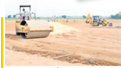
శాంతినగర్ లో సీఎం సభ ప్రాంగణాన్ని చదును చేస్తున్న ధృత్యం