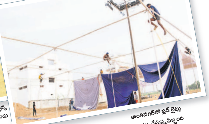
శాంతినగర్ లో ఫ్లడ్ లైట్లు ఏర్పాటు చేస్తున్న సిబ్బంది