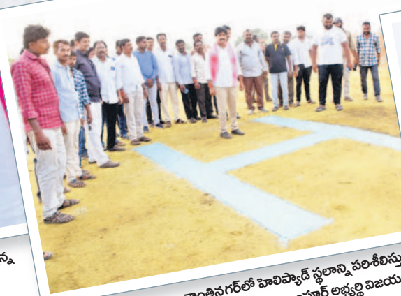
శాంతినగర్ లో హెలిప్యాడ్ స్థలాన్ని పరిశీలిస్తున్న అలంపూర్ అభ్యర్థి విజయదు