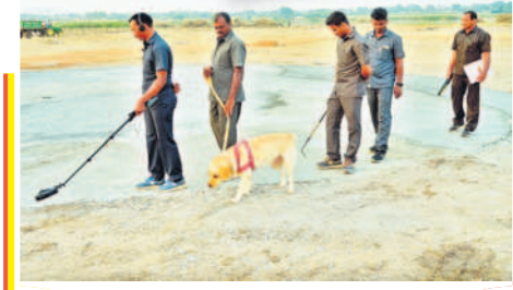
నాగర్ కర్నూల్ లో హెలిప్యాడ్ వద్ద డాగ్ స్క్వాడ్ తో పరిశీలిస్తున్న పోలీసు సిబ్బంది