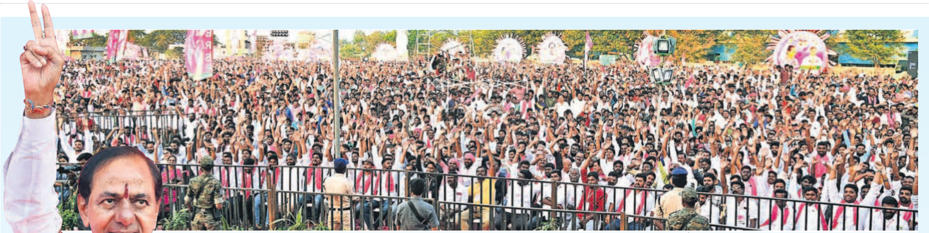
చేర్యాల ప్రజా ఆశీర్వాద సభకు పెద్ద ఎత్తున హాజరైన జనం, అభివాదం చేస్తున్న సీఎం కేసీఆర్