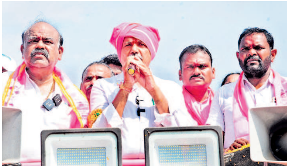
ప్రజా ఆశీర్వాద యాత్రలో మాట్లాడుతున్న భూపాలపల్లి అభ్యర్థి గండ్ర, పక్కన ఎమ్మెల్సీ సిరికొండ