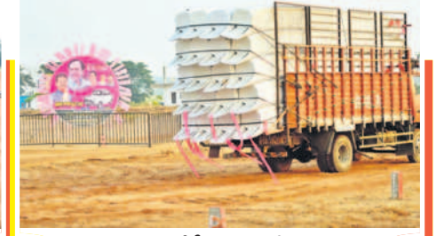
నాగర్ కర్నూల్ లో సీఎం సభకు తీసుకొచ్చిన సామగ్రి