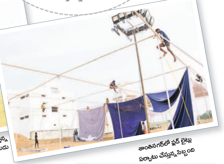
శాంతినగర్ లో ఫ్లడ్ లైట్లు ఏర్పాటు చేస్తున్న సిబ్బంది