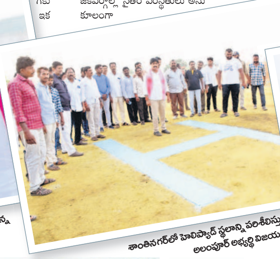
శాంతినగర్ లో హెలిప్యాడ్ స్థలాన్ని పరిశీలిస్తున్న అలంపూర్ అభ్యర్థి విజయదు