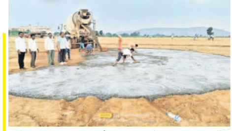
కొల్లాపూర్ లో హెలిప్యాడ్ కోసం ఏర్పాట్లు చేస్తున్న సిబ్బంది