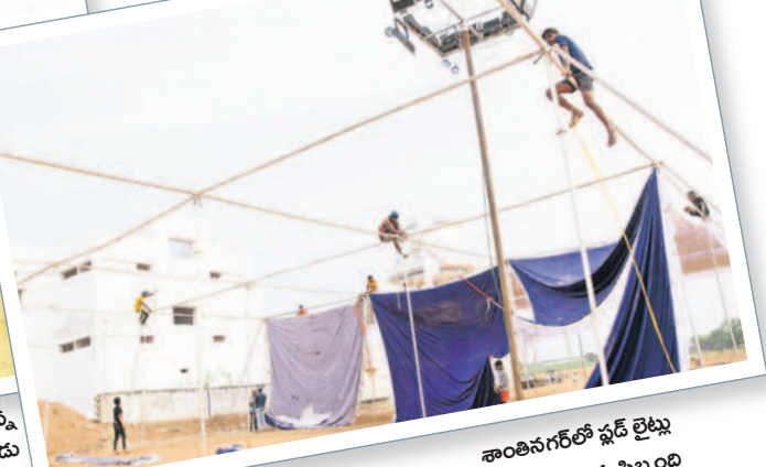
శాంతినగర్ లో ఫ్లెక్సీ లైట్లు ఏర్పాటు చేస్తున్న సిబ్బంది