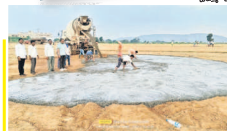
కొల్లాపూర్ లో హెలిప్యాడ్ కోసం ఏర్పాట్లు చేస్తున్న సిబ్బంది