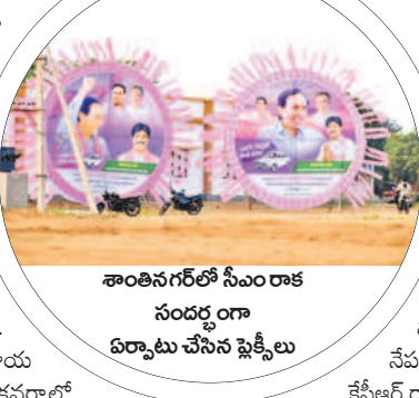
శాంతినగర్ లో సీఎం రాక సందర్భంగా ఏర్పాటు చేసిన ఫ్లెక్సీలు

నగా, ఆలస్యంగా వచ్చినా జనం కదలకుండా కుర్చీ వడం, కనీవీనీ ఎరుగని రీతిలో సభలు సక్సెస్ కావడంతో గులాబీ శ్రేణుల్లో ఉత్సాహం రెట్టింపయ్యింది. తాజాగా మరో సారి నాలుగు సభల్లో కేసీఆర్ పాల్గొంటుండడంతో విపక్షాల్లో వణుకుపుడుతున్నది. ఇప్పటికే ఆయా పార్టీల అధినాయకులు ఒకటి, రెండు నియోజకవర్గాల్లో మాత్రమే ప్రచారంలో పాల్గొన్నారు. మిగతా నియోజకవర్గాల్లో వస్తారో, రాకోననే బెంగ విపక్షాల అభ్యర్థుల్లో ఉంది. కానీ బీఆర్ఎస్ అధినేత అన్ని నియోజకవర్గాల్లో సభల్లో పాల్గొంటుండడంతో ప్రతిపక్షాలు ఆయామయానికి గురవుతున్నాయి.