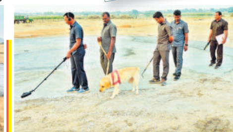
నాగర్ కర్నూల్ లో హెలిప్యాడ్ వద్ద డాగ్ స్క్వాడ్ తో పరిశీలిస్తున్న పోలీసు సిబ్బంది