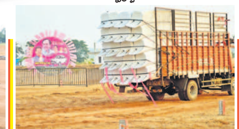
నాగర్ కర్నూల్ లో సీఎం సభకు తీసుకొచ్చిన సామగ్రి