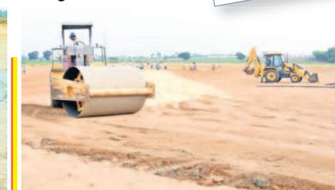
శాంతినగర్ లో సీఎం సభ ప్రాంగణాన్ని చదును చేస్తున్న ధృత్యం