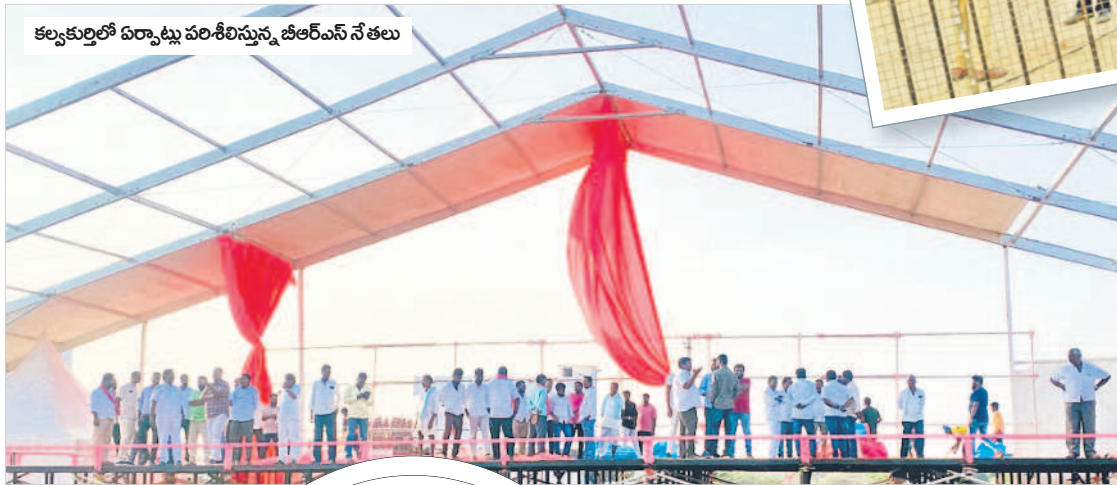
కల్వకుర్తిలో ఏర్పాటు పరిశీలిస్తున్న బీఆర్ఎస్ నేతలు

మహబూబ్ నగర్, నవంబర్ 18 (నమస్తే తెలంగాణ ప్రతినీడి) : బీఆర్ఎస్ అధినేత, ప్రగతి ప్రధాత కేసీఆర్ ఉమ్మడి జిల్లాలో నాలుగు ప్రజా ఆశీర్వాద సభల్లో నేడు పాల్గొంటున్నారు. జోగు లాంబ గద్వాల, నాగర్ కర్నూల్ జిల్లాలో ఎన్నికల జైత్రయాత్ర చేపట్టనున్నారు. ఈ మేరకు ఆయా నియోజకవర్గాల్లో పార్టీ అభ్యర్థులు, నాయకులు ఏర్పాట్లు చేస్తున్నారు. పెద్ద ఎత్తున జనసమీకరణ చేసే సభను విజయవంతం చేసేందుకు పోటాపో టీగా ఏర్పాట్లు చేస్తున్నారు. అసెంబ్లీ ఎన్నికల తుది అంకం ఘరూ కావడంతో కేసీఆర్ ప్రజాఆశీర్వాద సభలను చాలెంజ్గా తీసుకుని పార్టీ శ్రేణులు ఏర్పాట్లతో తలమునకలయ్యారు. మధ్యాహ్నం ఒంటిగంటకు అలంపూర్లో ప్రజాఆశీర్వాద సభ ప్రారంభంకానున్నది. మధ్యాహ్నం 2 గంటలకు కొల్లాపూర్లో, సాయంత్రం 3 గంటలకు నాగర్ కర్నూల్, 4 గంటలకు కల్వకుర్తిలో జరిగే ప్రజాఆశీర్వాద సభల్లో పాల్గొంటారు. పార్టీ అధినేత రాకతో ఆయా నియోజకవర్గ కేంద్రాలు గులాబీ మయంగా మారాయి. సభా వేదిక చుట్టూ భారీ కటాట్లు, ఫ్లెక్సీలు ఏర్పాటు చేశారు. రహదారులన్నీ జెండాలు, ఫ్లెక్సీలతో నిండిపోయాయి. గ్రామాల నుంచి పెద్దఎత్తున జనం కదలివస్తుండడంతో పోలీసు యంత్రాంగం భారీ బందోబస్తు ఏర్పాటు చేసింది. ఎక్కడ ఎలాంటి ఇబ్బందులు కలుగ కుండా సభా ప్రాంగణం చేరుకునేలా ఏర్పాట్లు చేస్తున్నారు. వివిధ ప్రాంతాల నుంచి వాహనాలను ఎలాంటి ఇబ్బందులు లేకుండా పార్కింగ్ చేసుకునేలా చదును చేశారు. జనాల వచ్చి పోవడానికి ఇబ్బందులు లేకుండా పార్టీ నాయకులు అన్ని ఏర్పాట్లు చేస్తున్నారు. నవంబర్ 16వ తేదీన కేసీఆర్ ఉమ్మడి జిల్లాలో ఏకంగా నాలుగు సభల్లో పాల్గొ