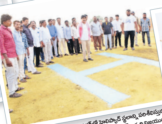
శాంతినగర్ లో హెలిప్యాడ్ స్థలాన్ని పరిశీలిస్తున్న అలంపూర్ అభ్యర్థి విజయదు