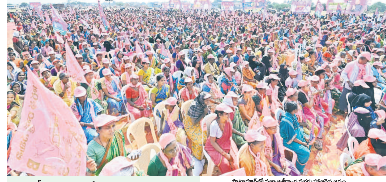
సాటాపూర్ లో ప్రజా ఆశీర్వాద సభకు హాజరైన జనం

గంటల కరెంట్ ఇస్తే మూడు ఎకరాలు పారుతాయని అంటున్నాడని, 3 గంటల కరెంట్ సరిపోతుందా అని ప్రశ్నించారు. బీఆర్ఎస్ పాలనలో కరెంట్ పోషాల్ని రైతులుంటు, రైతుబీమా ఇస్తున్నామన్నారు. కేసీఆర్ పాలనలో రైతులకు సకాలంలో ఎరువులు, విత్తనాలు అందుతున్నాయని, పండిత ప్రతి గింజనూ కొనుగోలు చేస్తున్నట్లు చెప్పారు. కాంగ్రెస్ కు ఓటి కర్షకులకు లెక్క, ఆగమగం కావొద్దని అయిన ఓట్లకు హితవుపలికారు. బీఆర్ఎస్ ప్రభుత్వం ఆసరా పింఛనను రూ.2000లకు పెంచిందని, మరోసారి అధికారంలోకి వచ్చిన తర్వాత రూ.5000 వరకు పెంచుతామని హామీ రావు హామీ ఇచ్చారు. రూ.400కి గానూ సీలిండర్ ఇస్తా