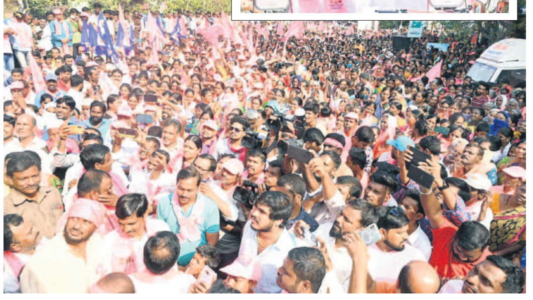
నిజామాబాద్ ఆర్ఆర్ చౌరస్తా వద్ద రోడ్ షోలో పాల్గొన్న ప్రజలు, మాట్లాడుతున్న మంత్రి హరిశ్ రావు (ఇన్ సెట్ లో..)