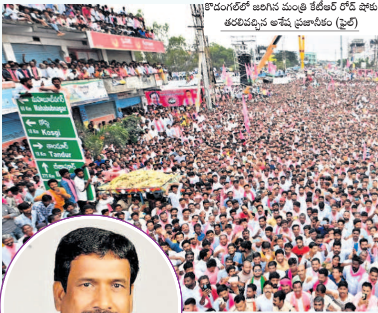
కొడంగల్లో జరిగిన మంత్రి కేటీఆర్ రోడ్ షోకు తరలివచ్చిన అశేష ప్రజానీకం (ఫైల్)