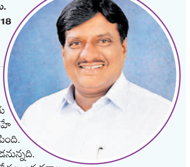
వికారాబాద్, నవంబర్ 18 (నమస్తే తెలంగాణ)