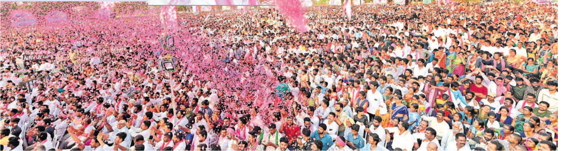
చేర్యాల ప్రజా ఆశీర్వాద సభకు హాజరైన అశేషజనం