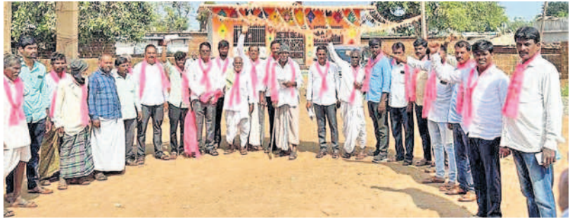
రూరాసంగం: గ్రామంలో ప్రచారం చేస్తున్న బీఆర్ఎస్ నాయకులు, కార్యకర్తలు