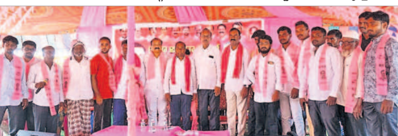
కోహిర్: బలాల్ పూర్ లో ఎమ్మెల్యే మాణిక్ రావు సమక్షంలో బీఆర్ఎస్ లో చేరిన కాంగ్రెస్ కార్యకర్తలు